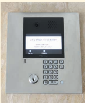
新しい集合玄関機が与える安心感と快適なコミュニケーション

今回取材させていただいたのは三井不動産レジデンシャルサービス東北が管理する宮城県仙台市青葉区の物件。竣工時から設置しているインターホンも19年目を迎え(概ね15年が更新の目安)、防犯性・利便性の向上のため、昨年改修工事を実施しました。改修により感じる快適性や、実施までの経緯など理事会の中心となり携わったお二方にお話を伺いました。